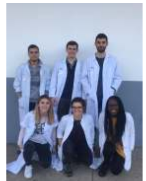
Voici l'équipe qui supervise le bon déroulement des opérations sur place :