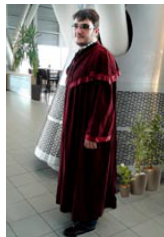
UN MAGISTRAT DE LA COUR DE JUSTICE

Le rapport de mission propose un certain nombre de mesures qui ont été présentées à la Ministre en personne par notre expert.