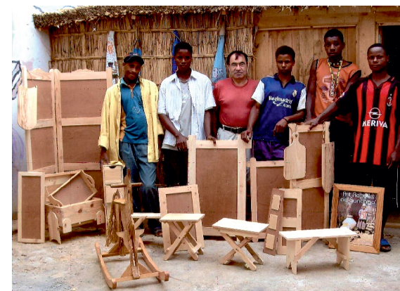
Formation de menuisiers