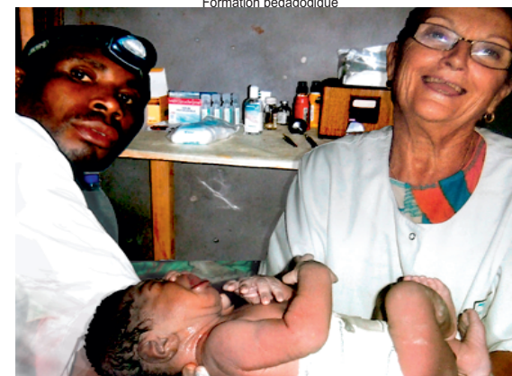
Formation d'un responsable santé