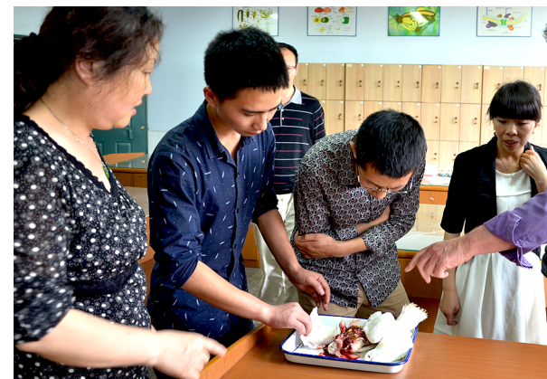
FORMATION DANS UNE UNIVERSITÉ TECHNIQUE.