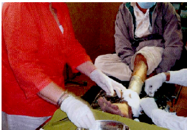
FORMATION AUPRÈS DES ÉTUDIANTS À PHOM PENH.