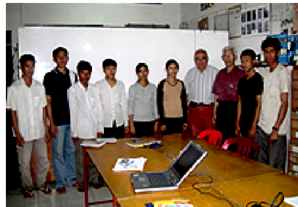
FORMATION À L'ÉLECTRICITÉ À PHNOM PENH