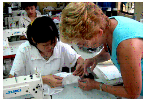
ENSEIGNEMENT DE LA COUTURE À HANOI