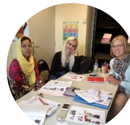
Français Langue Étrangère