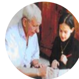
Aide à la scolarité