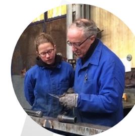
Maintien des savoirs de base