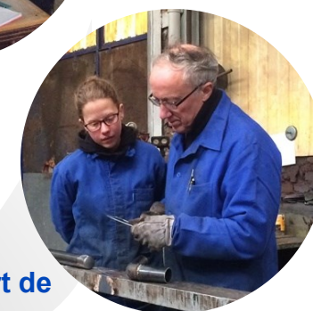
Apport de compétences