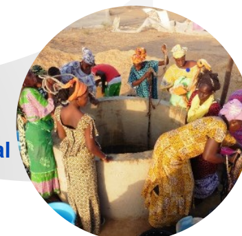
En France et à l'International